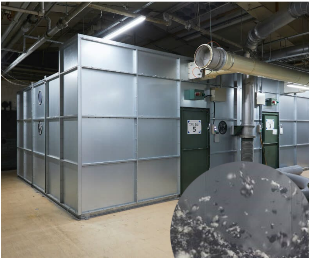
ストックビン外観と 中の調合の様子